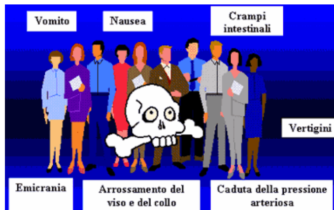
Fig. 3: Sintomi dell'intossicazione da istamina

La sindrome sgombroide è una patologia simil-allergica perché viene generalmente confusa con un'allergia alimentare. Quantità di 500 mg/kg o superiori